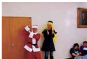
「コスプレ走」の様子