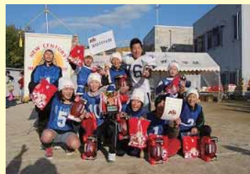
城陽市立古川小学校スマイルズB

閉会式をむかえ朝からのブロックリーグ戦、決勝トーナメントと白熱した「KYOTONCLC FLAG 2009」は盛況の内に幕を閉じました。