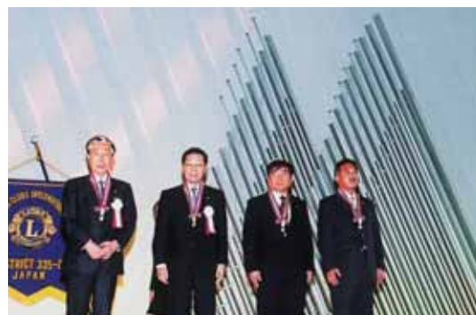
リーダーシップ賞受賞の皆さん