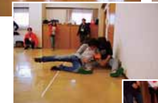
「ルームクラッカー」の様子

この競技はテレビなどでおなじみのビーチフラッグのフラッグを、クラッカーに代えた競技でした。うつ伏せに並んだ2名の競技者が、合