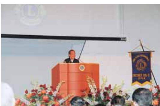
京都市長 門川大作様