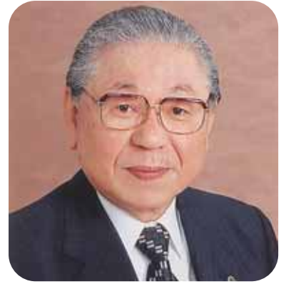
ライオンズクラブ国際協会 335-C地区ガバナー