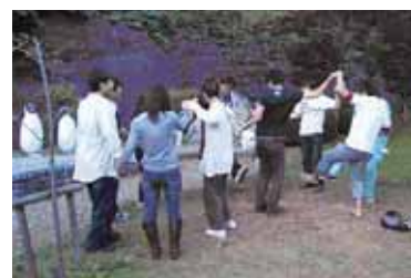
活動中のレクリエーションの様子。写真は表現対決