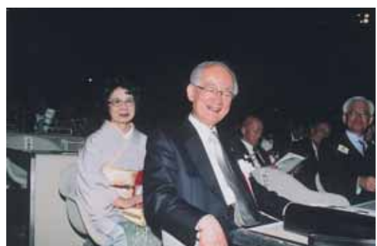
ガバナーエレクト御夫妻