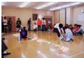
最下位決定戦の様子