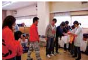
優勝した紅チームのメンバー