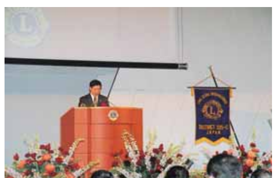
京都府知事 山田啓一様