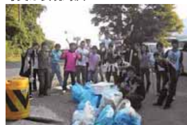
湖北にて全員で湖岸清掃