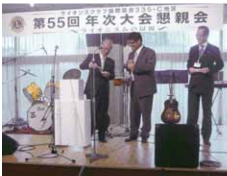
アトラクション抽選