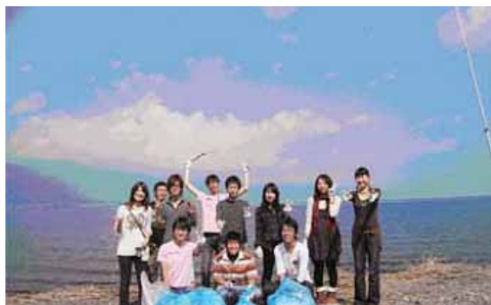
清掃を行った和邇浜での写真