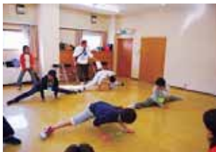
「開脚レース」の様子