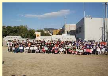
全チーム集合写真

そして、表彰式が行われ次はアメリカンフットボール選手たちが花道を作り、その中を子どもたちが通り表彰台まで進みました。 特別賞には、本日の試合で感動を誘った高槻市立五領小学校タイガースに贈られました。 その後、3位の藤ノ森小学校藤ノ森シルバーウィングス、2位の初出場の米原市立坂田小学校坂田小シルバーウィングスが表彰されました。 最後に、優勝した城陽市立古川小学校スマイルズBには優勝カップが手渡され、みんなから大きな拍手が送られました。その瞬間、彼らはチーム名のごとくとても素敵な笑顔（スマイル）を見せていました。