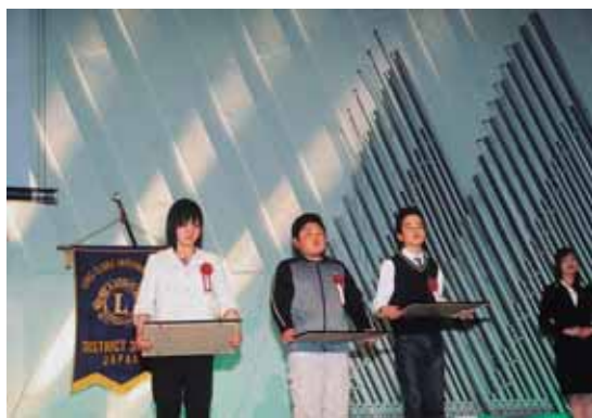
平和ポスターコンテストで 最優秀地区ガバナー賞を 受賞された方々