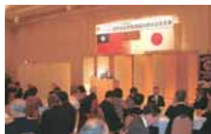
リーガロイヤルホテル京都