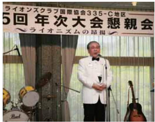
地区ガバナーし橋本御挨拶