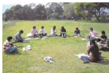
琵琶湖を眺めながら湖岸の公園での昼食の様子