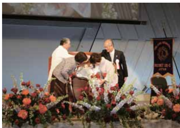
ガバナー夫人より エレクト夫人へ花束贈呈