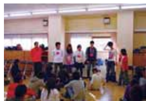
最下位の桃チームが自己紹介をする様子