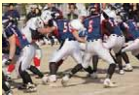
アメリカンフットボールの様子 試合の様子

普段、これほど近くで試合を見られないだけに子どもたちも本格的なプレーに食い入る用に見て技や攻め方などを参考にしていました。